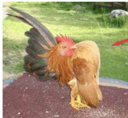
Forme à sanctionner